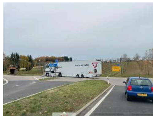
Weiterfahrt nach Zuladung in München

Es war die Ukrainische Hilfsorganisation ‚Support & Protection Center UA‘, welche uns gebeten hat, ihr beim Transport eines Fahrzeugs für mobile Kliniken behilflich zu sein. Der Sattelschlepper stehe in der Schweiz. Eine US-amerikanische Organisation schenke den Lastwagen. Und schon geht die Organisation los. Geladen werden fünf 2.5 kW-Generatoren, Rollatoren, Krücken, Infusionsständer, Toilettenstühle, die TECHshare geschenkt bekommen hat sowie medizinisches Hilfsmaterial, das in der Nähe von München auf der Fahrt noch zugeladen wird. Ein internationales Projekt!