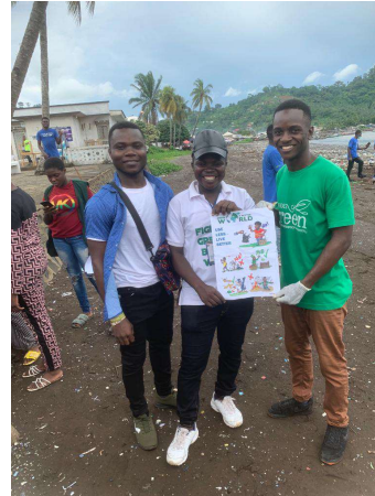
Die Gruppe „Green and better World“ in Limbe, verteilt Plakate „Use less, live better“.

Altöl Diesel-Treibstoff herzustellen. Altes Motorenöl wird in Kamerun oft einfach in die Erde geleert, in Bäche gekippt oder offen verbrannt. Es zu reinigen und als Diesel-Treibstoff-Zusatz zu verwenden ist allemal die bessere „Entsorgungslösung“.