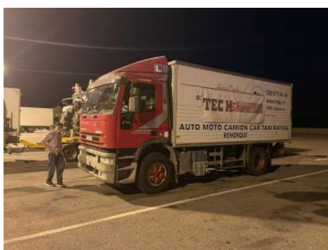
Übernachtung in Österreich

Der Transport war aber auch ein kleines Abenteuer. Ein Schreckensmoment im Projekt ergab sich bereits am Tag der geplanten Abfahrt am Dienstag, 15.08.2023. Alles war bereit, alle Papiere erstellt, getankt – Achtung, fertig los! Da hat der bestellte