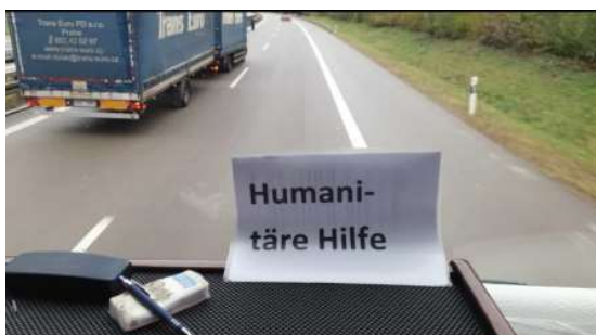
on the road