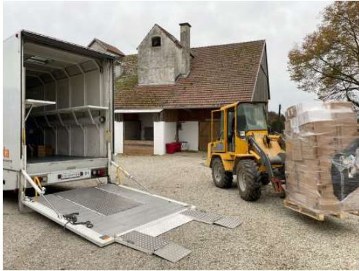
weitere Ware wird nahe München zugeladen

Am 14. November ging der Sattelschlepper auf Fahrt! Mit zwei freiwilligen Chauffeuren war der Lastwagenzug bereits am 15. November spätabends am Ziel an der Polnisch-Ukrainischen Grenze. Bereits am 17. November wurde der Lastwagenzug übernommen und in die Ukraine geführt, wo die mobile Klinik daraus entsteht.