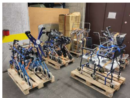
Rollatoren und anderes medizinisches Material