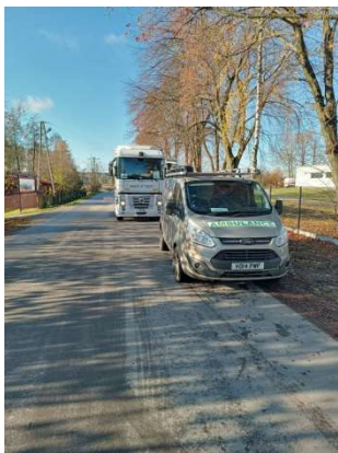
Der Sattelschlepper in der Ukraine

Am 14. November ging der Sattelschlepper auf Fahrt! Mit zwei freiwilligen Chauffeuren war der Lastwagenzug bereits am 15. November spätabends am Ziel an der Polnisch-Ukrainischen Grenze. Bereits am 17. November wurde der Lastwagenzug übernommen und in die Ukraine geführt, wo die mobile Klinik daraus entsteht.