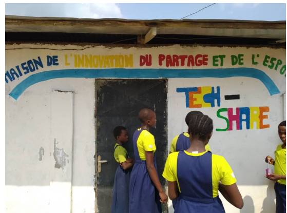
Das TECHshare-Logo etwas anders am Schulgebäude

In der Schule im Süden der grossen Hafenstadt Douala in Kamerun wird nicht nur das ABC gelehrt. Seit dem Kleinkindalter wird Kindern der ärmsten Bevölkerungsschichten auch alles Wissenswerte über Gesundheit beigebracht und auf diese geachtet. Die Kinder erhalten Mahlzeiten, haben Zugang zu Spielen, bei denen sie etwas lernen können und werden darauf vorbereitet, in Zukunft im Leben unabhängig und erfolgreich zu sein. Auch die Eltern werden sensibilisiert, wie wichtig die Ausbildung für die Kinder ist, damit sie sich in Zukunft an der Weiterentwicklung der Heimatdörfer beteiligen können.