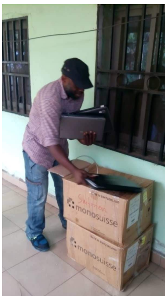
... und Ankunft in Kamerun