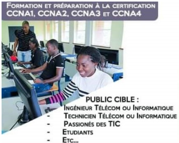
Schulungen in von TECHshare unterstützten Bildungsstätten in Conakry, Guinea