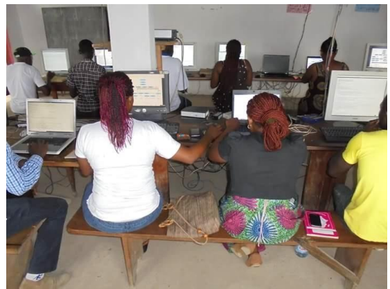
Bild aus Zeiten des Schulbetriebs