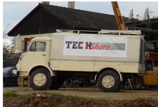
Vollständig ausgerüstete, fahrende Werkstatt bereit für den Einsatz