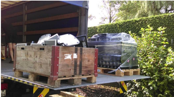
Anlieferung der PCs ins Lager

Von der Firma EOS Schweiz AG haben wir fast 100 PCs erhalten. Die Geräte könnten in verschiedenen Projekten eingesetzt werden. Jedoch fehlt zur Zeit das Geld für einen Transport an ein potentielles Projekt. Die Geräte sind deshalb in unserem Lager bis sich die finanzielle Situation verbessert.