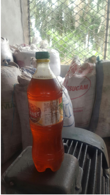
... zum marktfertigen Produkt