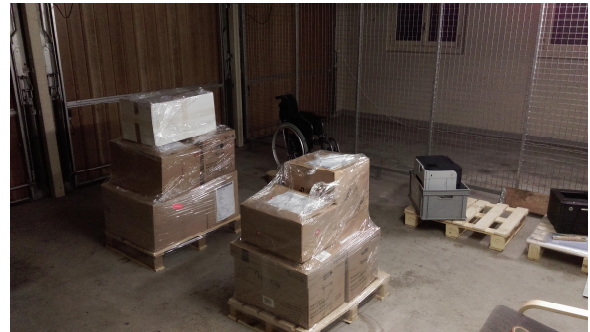
Material für Kissidougou im Lager in der Schweiz

Auch in diesem Jahr haben wir das Projekt Kissidougou mit 14 Laptops und 3 PCs unterstützt. Der Verantwortliche schreibt: „Wir haben gemerkt, dass Tablets besser geeignet sind wegen der hohen Laufzeiten und der höheren Resistenz gegen Staub und Erschütterungen (keine Festplatte, keine Tastatur). So werden wir in einem Monat mit einem Android-Kurs beginnen. Wir haben bereits 6 Geräte, hätten aber Bedarf für doppelt so viele Geräte.“