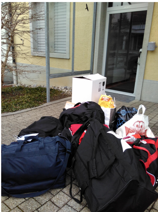
neue Ladung Fussball-Sachen bestens verpackt

Nochmals herzlichen Dank allen Spendern von Fussballbekleidung und Bällen!