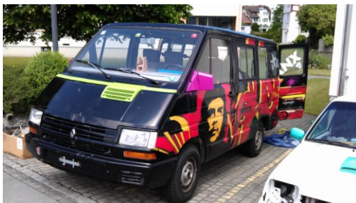
Renault Bus geladen mit vielen nützlichen Dingenn