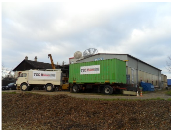
Lastwagen für die Berufsschule in Kamerun