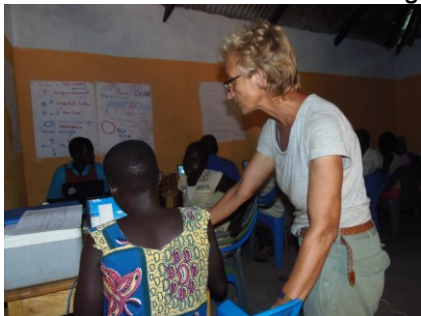
Laptops im Einsatz im Südsudan

Die im vergangenen Jahr gelieferten 20 Laptops sind im Einsatz. Allerdings sind die Umstände im Südsudan haarsträubend: "Momentan ist es hier nur schwer möglich zu leben. Wir haben kürzlich zwei Erschossene im Dorf gehabt. Die Leute laufen aus Angst davon. Dabei wäre es wohl ratsamer Zuhause zu bleiben." Bei längeren Abwesenheiten müssen Sicherheitsvorkehrungen getroffen werden: "Es ist nicht gut, den Militärs zu zeigen, was wir im Dorf haben. Ich werde die Ware (Laptops) vergraben müssen, weil der Wachmann eindringender offizieller Gewalt mit Plünderungsabsicht nicht gewachsen sein wird. Bei einer Weissen zeigen nicht-betrunkene Militaers ein wenig Respekt."