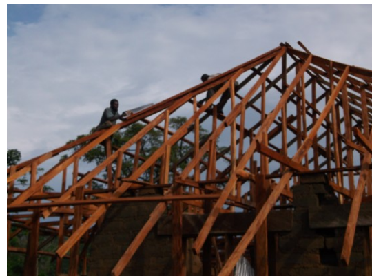
Dach der Krankenstation in Assaka