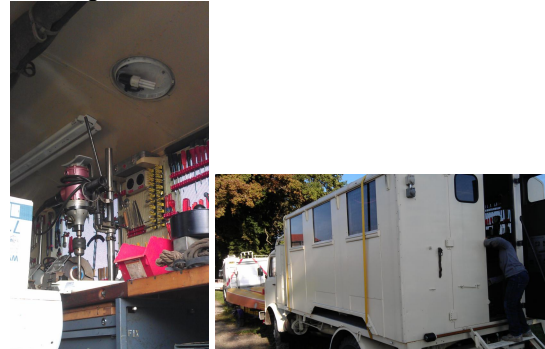
Mobile Werkstatt in einem Militär-LKW Steyr