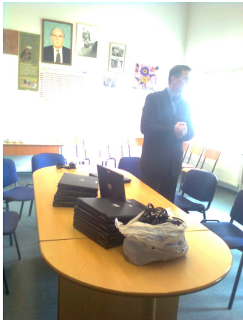
Ankunft von Laptops in Chabra

weiter in den Kosovo transportiert. Herzlichen Dank allen Beteiligten!