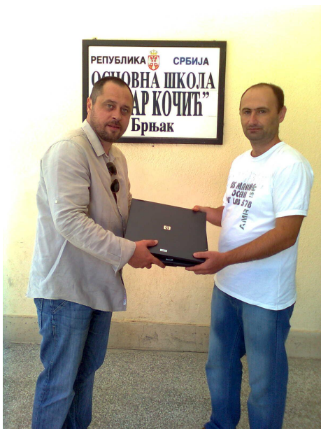
Übergabe von Laptops in der Brnjak Schule