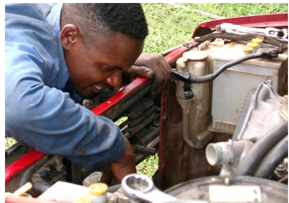
Automechaniker in Kamerun