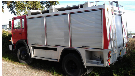
Lastwagen für Kamerun

Kumba, Kamerun, vorgestellt. Die Verhandlungen haben sich über das ganze Jahr 2013 hingezogen. Die lokalen Behörden in Kumba sind bereit, ihren Teil (Land, Gebäude, Zollbefreiung etc.) zu leisten. Jedoch braucht es Zeit, sehr viel Zeit, bis alles vertraglich geregelt ist. In Afrika hat man Zeit, aber kein Geld. In Europa ist es eher umgekehrt. Doch das Projekt ist auf gutem Weg. Der Nutzen wird grossartig sein, weil in den Bereichen Mechaniker, Schreiner, Maurer, Zimmerleute ein grosser Mangel an Know-How besteht. In einer ersten Phase werden auch mobile Werkstätten unterwegs sein. Vier Lastwagen stehen zum Transport nach Kamerun bereit. Und um etwas ins 2014 vorzugreifen. Von den CHF 30'000 für die Verschiffung der vier Lastwagen sind bereits 3/4 der Summe zusammengekommen. Das Projekt kann starten.