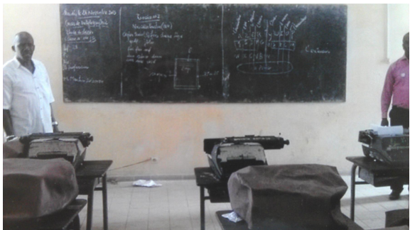
Die Schreibmaschinen werden weiterhin zur Ausbildungszwecken genutzt